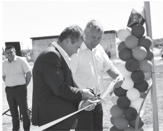
пунктов Республики Крым» за счёт средств республиканского бюджета на общую сумму 37,2