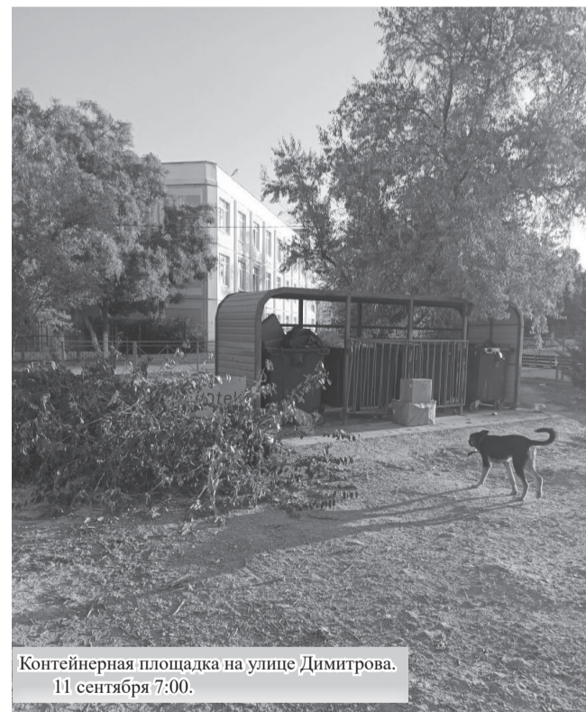
Контейнерная площадка на улице Димитрова. 11 сентября 7:00.