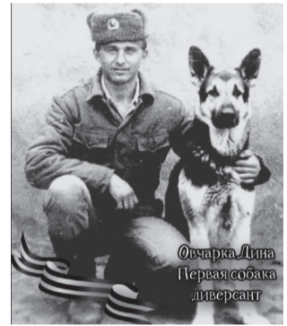
Овчарка Дина — первая собака диверсанта

Во время Парада Победы на Красной площади в 1945 году он не мог сам идти в строю из-за ранения, и пса по приказу Сталина пронесли на параде на руках.