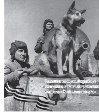
Немецкая овчарка Джульбарс

Собаки самых разных пород по праву признаны животными — героями Великой Отечественной войны, ведь они помогли спасти сотни тысяч человеческих жизней. Давайте вспомним этих маленьких героев большой войны.