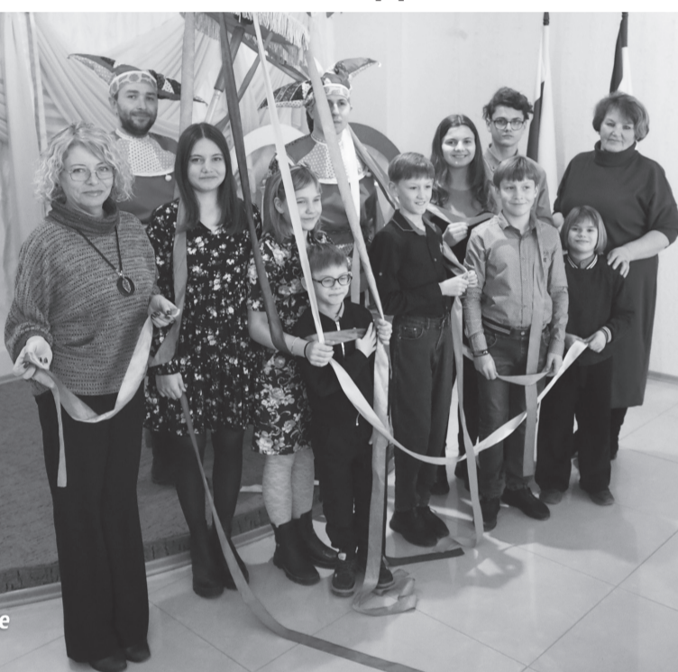
Материалы рубрики подготовила Ярослава ФИЛИППОВА

Праздник прошел очень интересно и весело, все без исключения получили положительные эмоции и выразили слова благодарности работникам Центра социальных служб для семьи, детей и молодежи, Черноморского ДК и ЗАГСа.