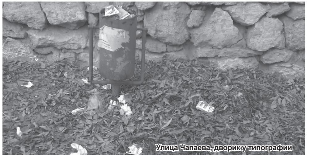
Улица Чапаева, дворик у типографии

Летом принято пенять на отдыхающих. Да, разные люди бывают. Приходилось видеть порой, как, отведав чебуреков или беляшей, несознательные граждане элегантно пускали