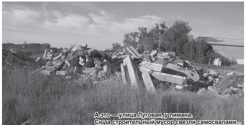
А это — улица Луговая, у лимана. Сюда строительный мусор свезли самосвалами...

по ветру салфетки, или ленились донести до урны на городском пляже остатки пиршества. Но курортники давно разъехались, а мусор продолжает волшебным образом появляться. И мы сейчас говорим не о каких-то отдаленных, глухих переулках (хотя мусорить нигде нельзя). Речь о том же городском пляже, о центральных улицах, где с завидным постоянством